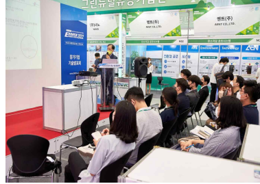
기술 발표회장 구조